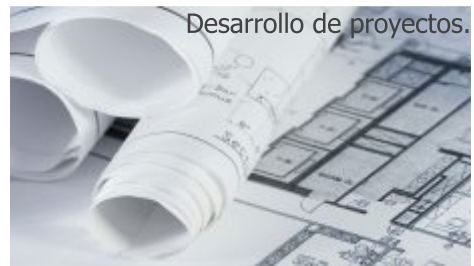
Desarrollo de proyectos.