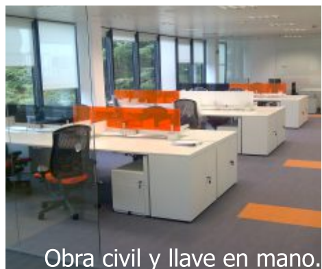
Obra civil y llave en mano.