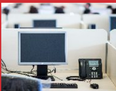
Contact center_ Implantación.

_Facility Management para la gestión de infraestructuras y de recursos auxiliares dirigidos a optimizar los espacios corporativos y el entorno de trabajo, para que nuestros clientes puedan centrarse en la actividad principal de su negocio.